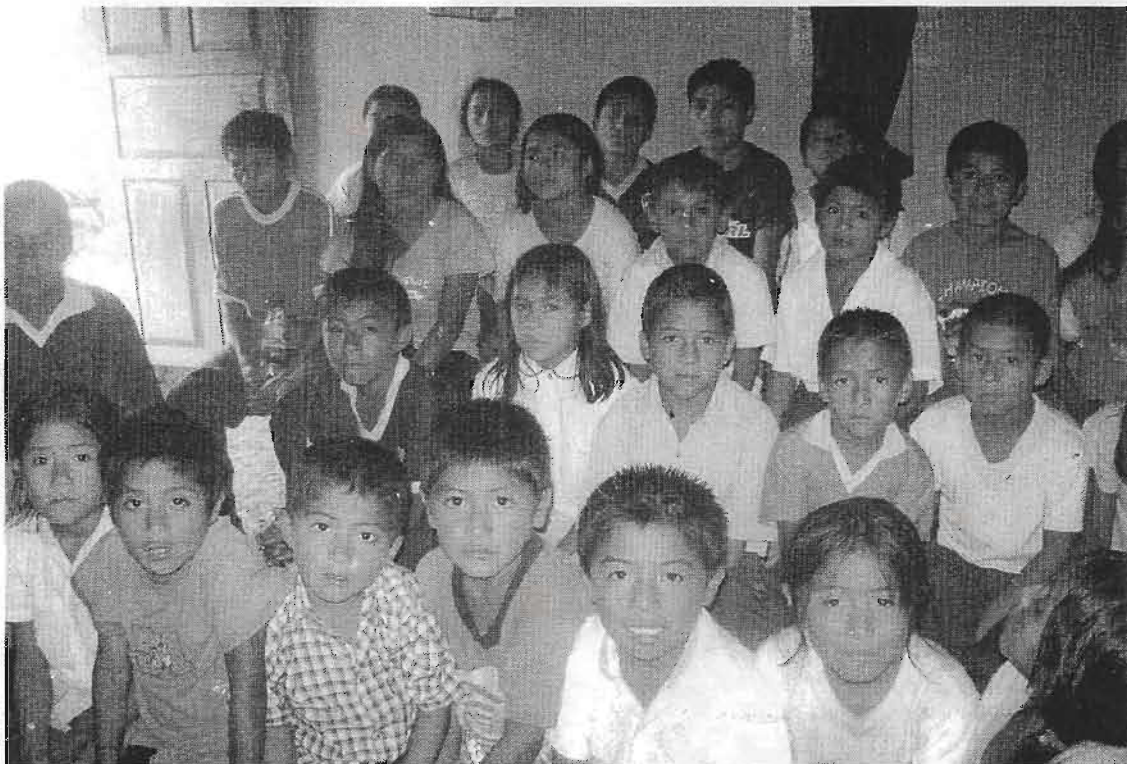
UNA MIRADA CRUDA. Otras evidencias de los vínculos entre la pobreza y la desnutrición crónica revelan que ésta afecta con mayor intensidad a niñas y niños de madres sin nivel de educación (55,1%).