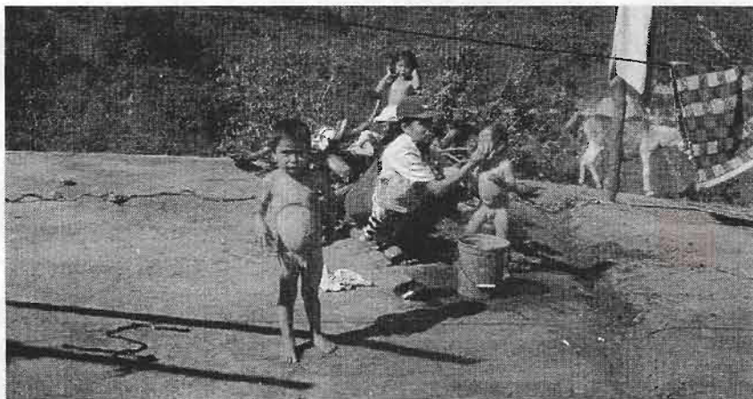
APUESTA POR LOS NIÑOS. Los políticos deberían apostar por la niñez, antes que por sus propios intereses, pues con niños y niñas sanos, aseguramos ciudadanos capaces para el futuro... ¿han sido considerados en sus planes? ¿Ud. ciudadana ya los leyó?

sólo por la cantidad y magnitud de las obras de infraestructura, sino por los logros en el desarrollo humano de los ciudadanos. Los políticos deberían apostar por la niñez, antes que por sus propios intereses, pues con niños y niñas sanos, aseguramos ciudadanos capaces para el futuro.